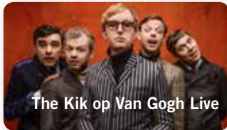
The Kik op Van Gogh Live